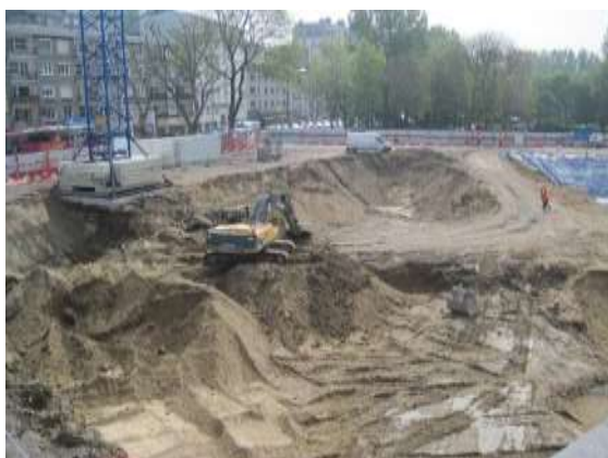
Vue de la partie gauche du chantier (côté Bd St-Beuve)