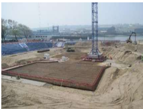
Vue de la partie droite du chantier (côté quai des Paquebots) où on voit le radier du grand bassin en cours de construction