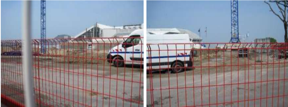
Vues du chantier (côté parc urbain)