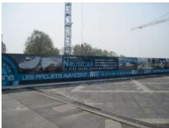
Vue de la palissade délimitant le chantier (côté parvis de «Nausicaá»)