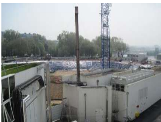
Vues générales du chantier avec au premier plan des bâtiments annexes de l'actuel «Nausicaá»