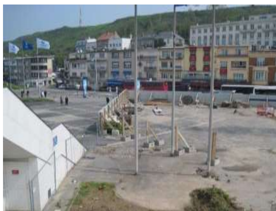
Vue générale du boulevard Sainte-Beuve et de l'implantation du chantier par rapport à celui-ci.