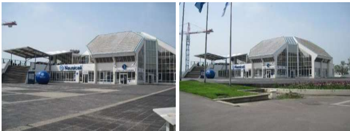
Vues générales du bâtiment actuel de «Nausicaá» et son entrée. Au premier plan on voit le parvis où sera implantée la partie « Aurores Polaires ».

Les photographies suivantes ont été prises par nous-même.