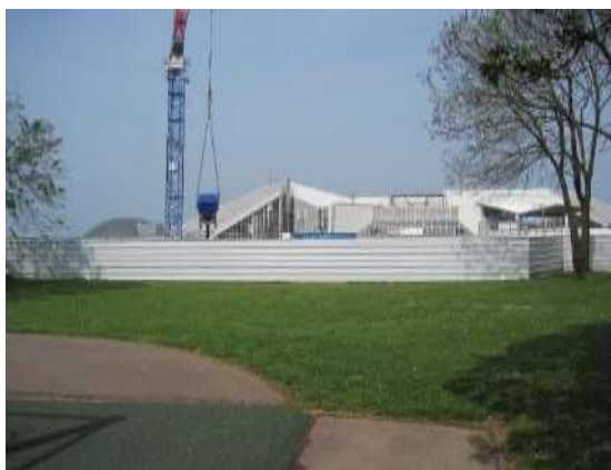
(côté parc urbain) Au fond, on voit le bâtiment actuel de «Nausicaá».